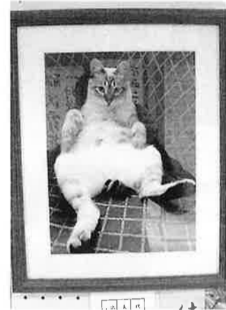
(写真) 横須賀六子 佳作