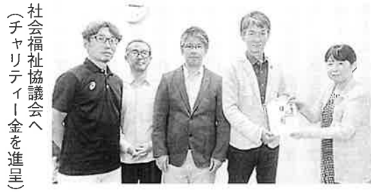
社会福祉協議会へ(チャリティー)金を進呈

声やハイタッチと盛り上がりを見せ楽しい時間を過ごしていました。腕もパンパンとなり、二ゲームを終え表彰式。チーム戦一位は器具商六社で使える五千円分の商品券、二位は四千円分、三位は三千円分、四〜六位は千円分、他にもハイゲーム賞など皆さんに景品が渡るようになっています。今回皆様から頂いたチャリティー募金は、総額三万五千六百円を社会福祉協議会に進呈してきました。ご協力ありがとうございました。