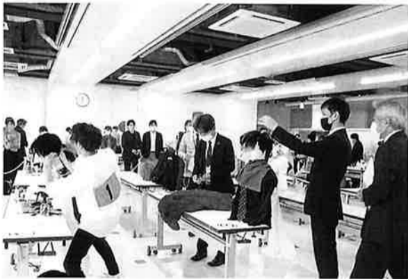
滝口支部長(モデル審査中)