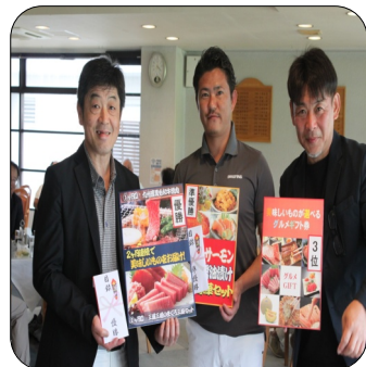
個人男子 優勝 船橋 2位 東金 3位 市原