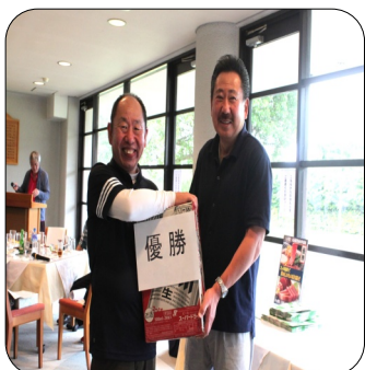
団体戦 優勝 市原 2位 東金 3位 中央