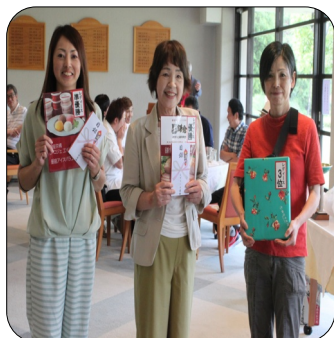
個人女子 優勝 長生 2位 市原 3位 習志野