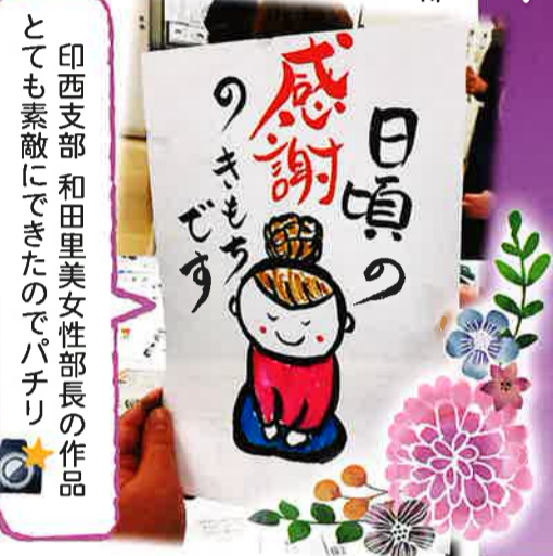
印西支部 和田里美女性部長の作品 とても素敵にできたのでパチリ