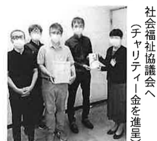
社会福祉協議会へ(チャリティー金を進呈)

タカラ椅子代理店 新明和椅子前洗面代理店 理美容店舗設計施工 理・美容器材・有名化粧品卸