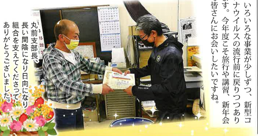
丸前支部長、長い間陰になり日向になり組合を支えてくださってありがとうございました。

いろいろな事業が少しずつ、新型コロナウイルスの流行前に戻りつつあります。今年度こそ旅行や講習、新年会で皆さんにお会いしたいですね。