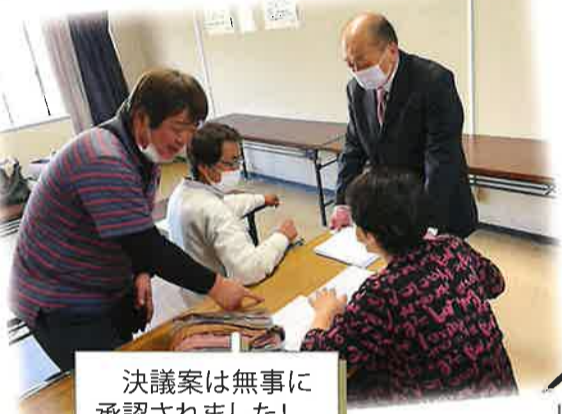
決議案は無事に承認されました!

各級の班長さん方に、短い期間での議決権行使書の回収、任意保険の集金、3年度末には助成金の配布、本来なら総会席上で表彰される方々に表彰状を渡していただくなど、多岐にわたる依頼を正確に実行していただきました。ご協力ありがとうございました。