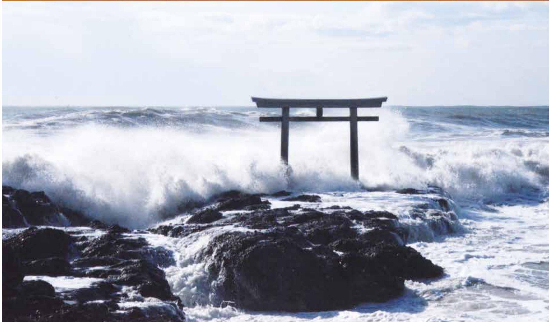
「荒波に立つ」大洗の海